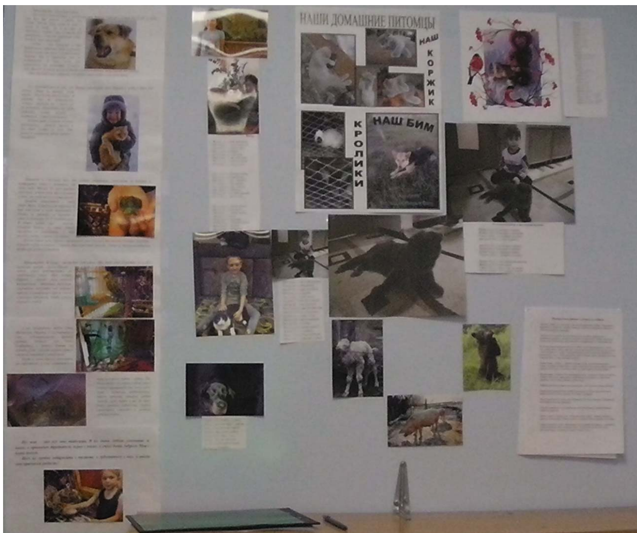
Новостью поделилась воспитатель группы «Буратино» М.В. Орешкина