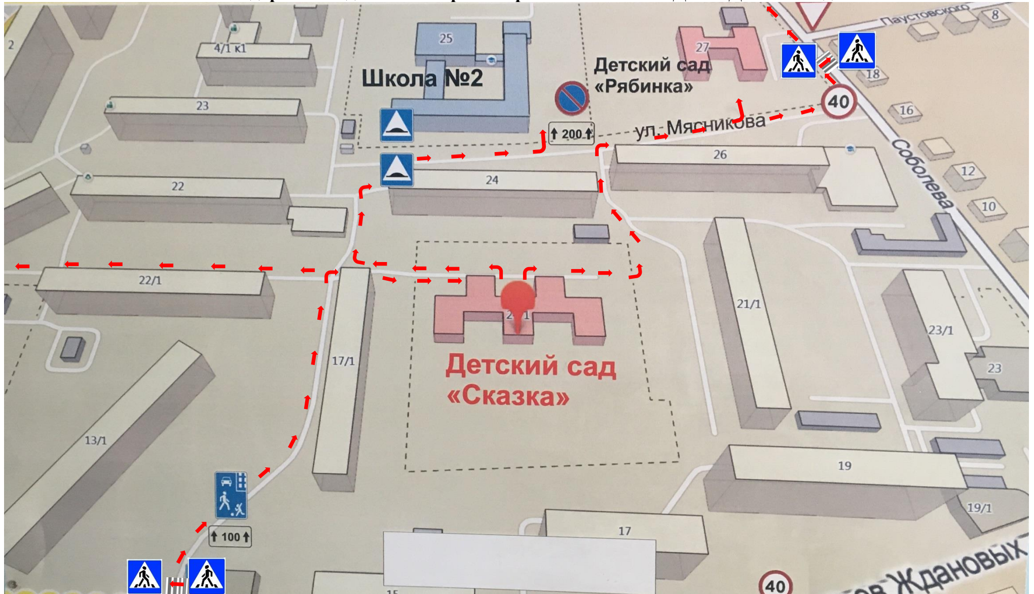
Схема безопасности дорожного движения в районе расположения МБДОУ «Детский сад «Сказка»